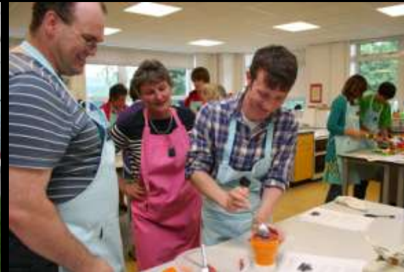
Gweithdy coginio a barbeciw 2010 Cookery workshop & BBQ 2010