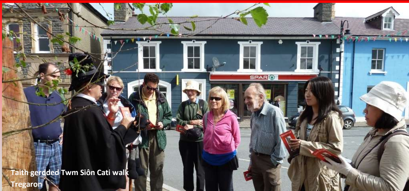
Taith gerdded Twm Siôn Cati walk Tregaron