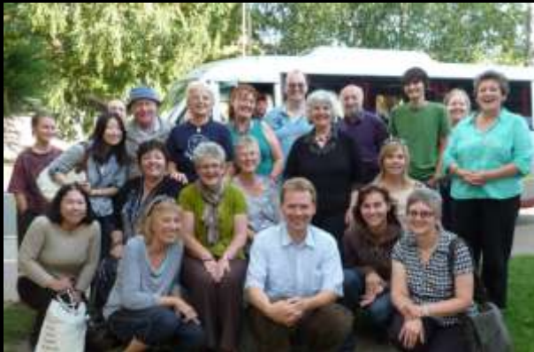
Taith i'r Eisteddfod Genedlaethol 2010 Trip to the National Eisteddfod 2010