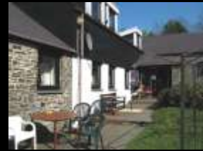
Clwb Brynamlwg Club